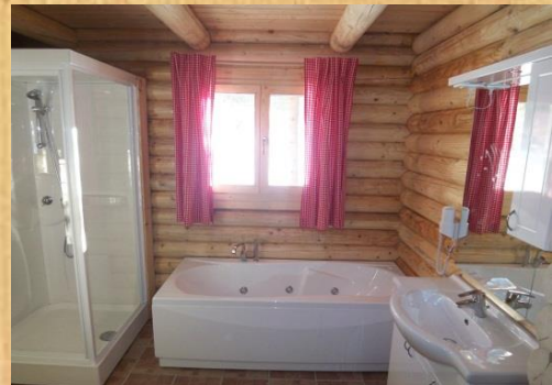
Badezimmer mit Wanne, Dusche, zwei Waschbecken und Sauna