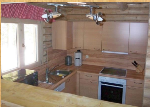
Gut ausgestattete Küche