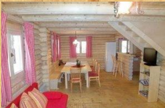
Wohnraum mit Schwedenofen, Couch und Flachbildfernseher

Halbpension: Kinder bis 2,99 Jahre frei; 3-11 Jahre € 10,90; ab 12 Jahren € 18,00