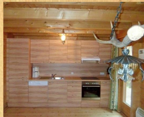
Gut ausgestattete Küche